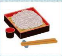
そば grano saraceno