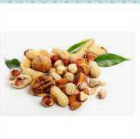
ナッツ frutta a guscio