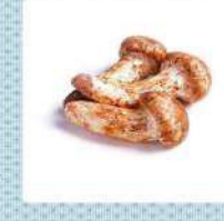
松茸 funghi matsutake