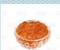
イクラ uova di salmone